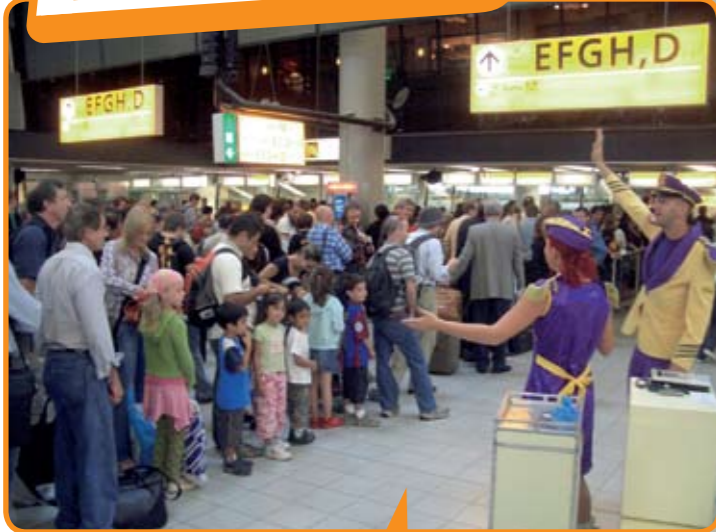
Aaaahal the Actor Factory produceert jaarlijks een show voor wachtende passagiers op Schiphol.