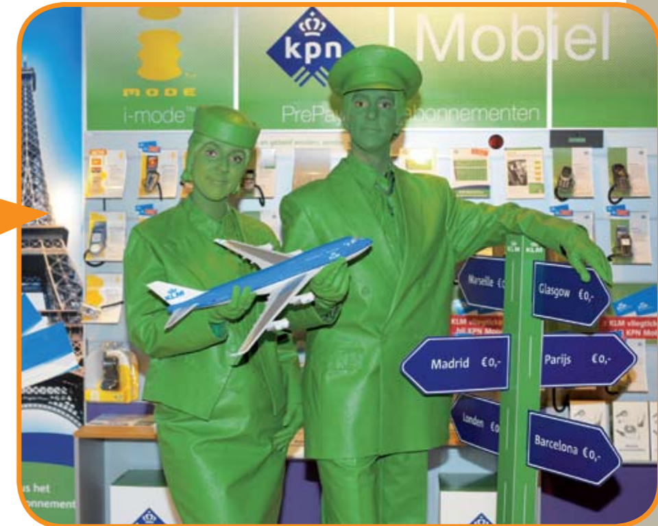
KPN groene piloten en stewardessen vestigen de aandacht op een actie waarbij men een vliegticket ontvangt bij elk nieuw contract.