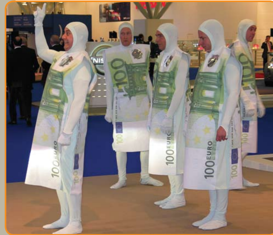
ING geldmannetjes stelen de show op de VIP borrel van de autoRAI.