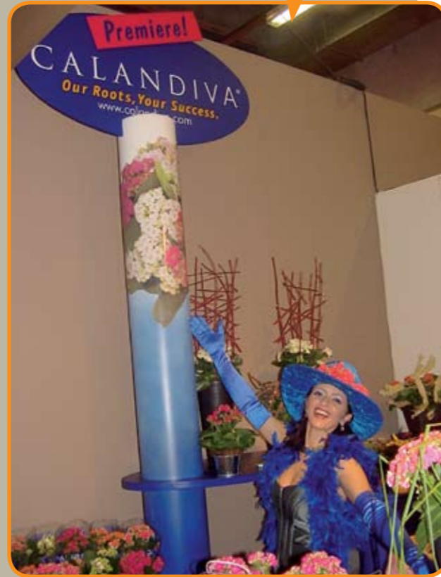
Onze zangeres is de Calandiva. Zij introduceert de gelijknamige plant op de Hortifair.