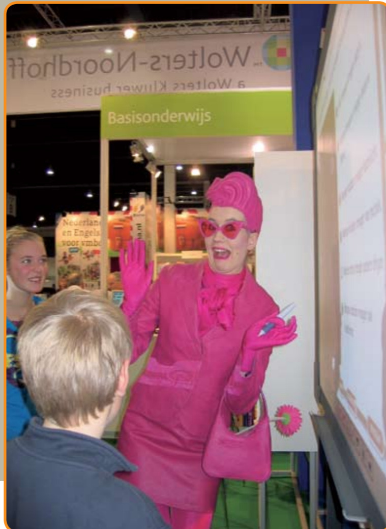
Magenta gekleurde actrices brengen de leermiddelen van EPN onder de aandacht op de Nationale Onderwijs Tentoonstelling.