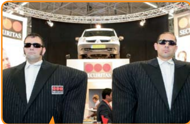
Enorme bodybuilders verzorgden de beveiliging op Safety & Security.