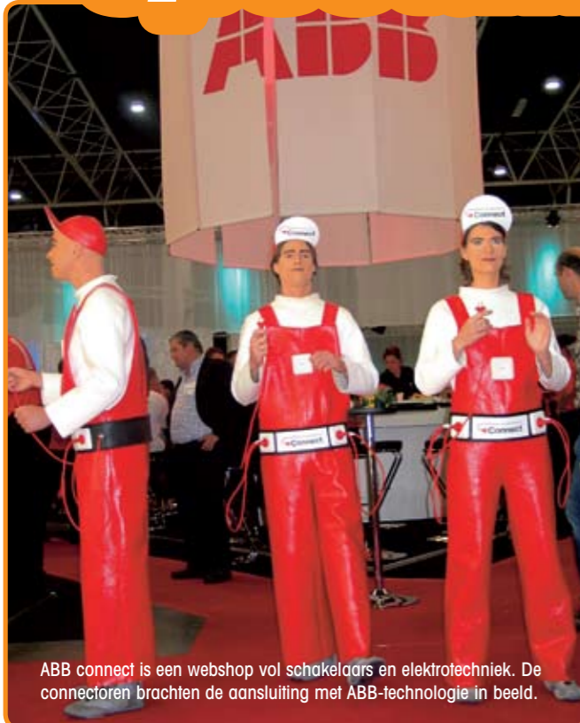
ABB connect is een webshop vol schakelaars en elektrotechniek. De connectoren brachten de aansluiting met ABB-technologie in beeld.

Wij creëren opvallend visueel spektakel op maat. Op de beurs elektrotechniek maakten wij bijvoorbeeld de connectoren voor ABB Connect. Een filmpje kunt u bekijken op onze website www.beursacteurs.nl